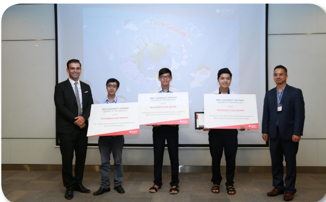
Nhóm học sinh được trao giải nhất cuộc thi TechGenius.

Đặc biệt, bộ cờ vua "The Legends" in bằng công nghệ 3D đã