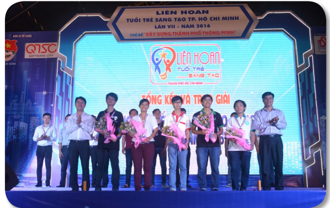
Trao giải vàng của giải thưởng Thiết kế Chế tạo Ứng dụng 2016.

nghe thông tin, Đại học Khoa học Tự nhiên TP. HCM. Máy có thể cắt giấy, khắc trên gỗ và nhựa, được điều khiển qua môi trường internet; có thể cắt được các tác phẩm có độ khó cao như: Chợ Bến Thành, Chùa Một Cột, chân dung các danh nhân,... Với tính khả thi cao trong lĩnh vực gia công mỹ thuật, chế tác số, kLaserCutter cũng đã đạt nhiều giải thưởng như huy chương đồng Liên hoan Tuổi trẻ sáng tạo TP. HCM 2015; giải nhì cuộc thi Nhà sáng tạo Việt Nam với Intel Galileo 2015; là 1 trong 3 dự án được chọn đại diện cho sinh viên Việt Nam trình bày với Tổng thống Hoa Kỳ Barack Obama trong buổi gặp mặt các nhà lãnh đạo trẻ và các doanh nghiệp khởi nghiệp Việt Nam.